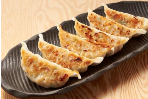
ラーメンといえば、餃子は欠かせない！ 栃木県・悟空「特製肉餃子」540円/4個入